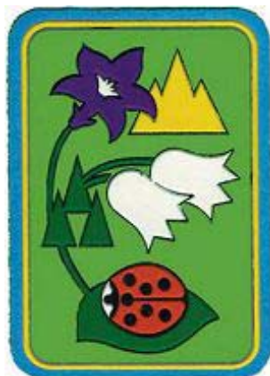
Coccinella della montagna

Allegato 2 Elenco delle specialità Amico degli animali Amico della natura