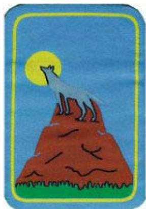
3° momento: Lupo anziano