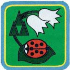
Coccinella del bosco