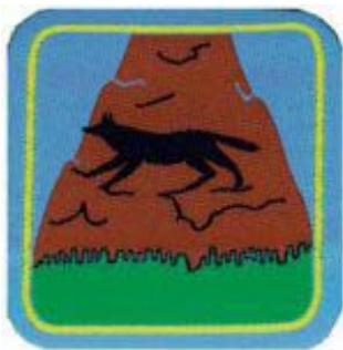
2° momento: Lupo delle rupe